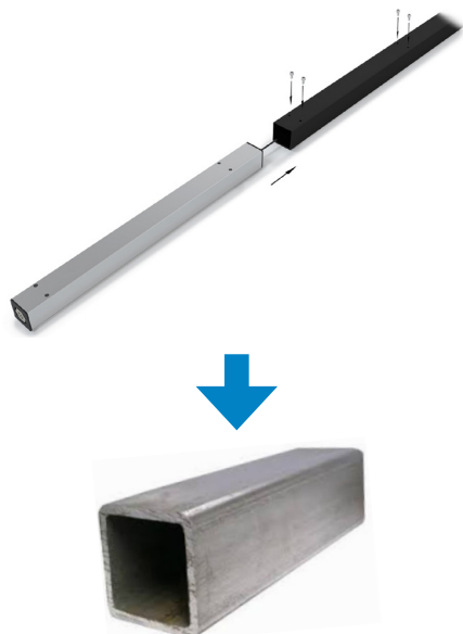
Vložení zvedací jednotky přímo do čtvercového profilu